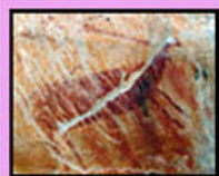
Tabla el Pochico

es un salto de agua de unos 40 metros de altura que se produce como consecuencia de una falla transversal al cauce del río Guarrizas dejando expuesta una pared vertical formada por unos estratos excepcionalmente resistentes a la erosión de cuarcita "armoricana". Se encuentra a dos km del centro urbano en dirección sur, tiene la categoría de Paraje Natural. Situada en el extremo oriental de Sierra Morena. Sus rocas pertenecen a la Zona Centro-Ibérica. El relieve, suavemente alomado y disectado de norte a sur por el desfiladero de Despeñaperros, se forma sobre rocas metamórficas de edad Precámbrico a Carbonífero (hace unos 320 millones de años) mayoritariamente lo forman pizarras, cuarcitas y calizas metamórficas. Desde la Aldeilla bajamos por el carril hasta el pueblo y una vez llegamos al cruce giramos a la izquierda cogiendo la carretera que nos lleva directa al paraje. El camino es cómodo y apto para todos, sólo se debe tener precaución una vez lleguemos al propio entorno de la Cimbarra. Desde la Aldeilla tres kilómetros.